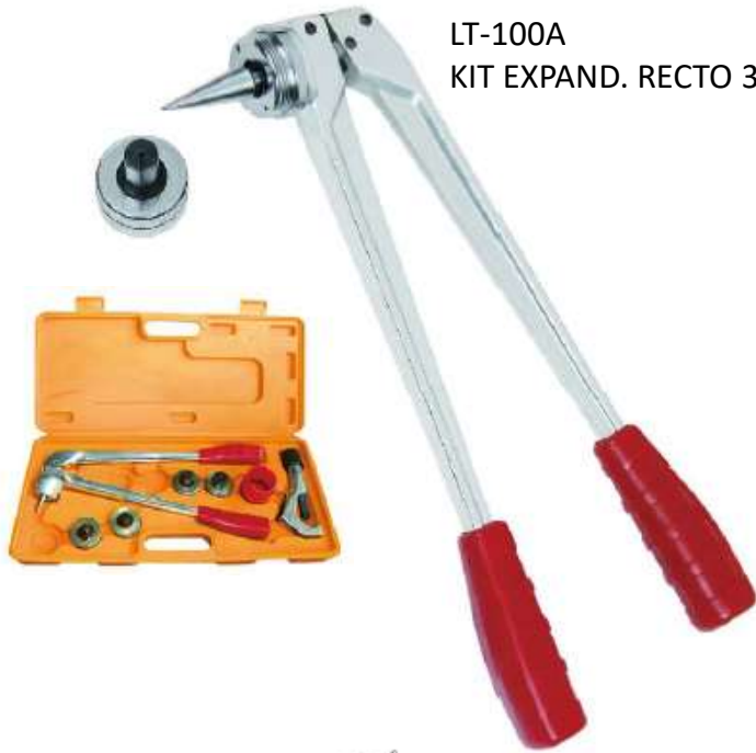
LT-100A KIT EXPAND. RECTO 3/8"~7/8", 1~1/8"/C.TUBO/ESCARIAD