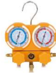
ZR-M50336A MANIFOLD R-410A 36" R22 / R134A / R404A / R404A