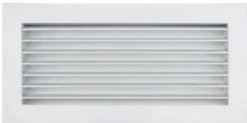
RG-A REJILLA EXTRACCION CON DAMPER TODAS LAS MEDIDAS