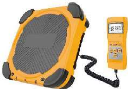
LMC-200 BALANZA DIGITAL PROGRAMABLE 100Kg / 220Lbs

ZRU-4A BOMBA VACIO 8CFM 240 L/min. 220V / 50HZ