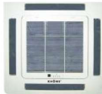
EQUIPOS SPLIT CASSETTE R-410A 12.000 - 18.000 -24.000 -36.000 – 48.000 – 60.000 BTU