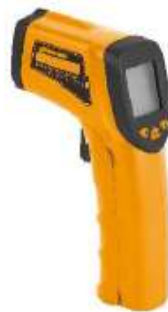
WT-2 TERMOMETRO PORTATIL