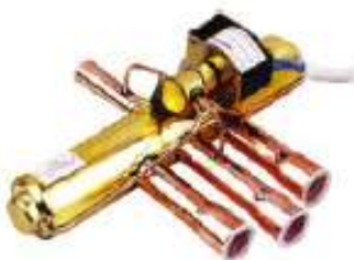
DSF-4 VALVULA REVERSIBLE 5/16"x3/8" BOBINA 220V