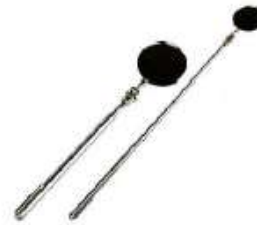
CT-80 ESPEJO DE INSPECCION 2" 27.5 43CM