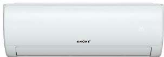
EQUIPOS SPLIT MURO ECOLOGICOS R-410A 9.000 -12.000 -18.000 – 24.000 BTU 220V