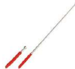
CT-60 IMAN EXTENDIBLE TIPO ANTENA