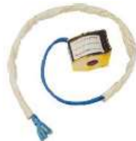
SW-01 BOBINA BOMBA DE CALOR 220V - 50HZ/60HZ - 6W/5W