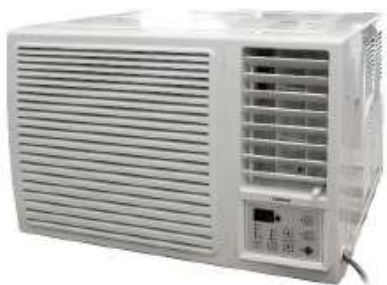
EQUIPOS VENTANA ECOLOGICOS R-410A 9.000 -12.000 BTU/HR