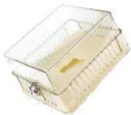
77-PG9 CAJA CUBRE TERMOSTATO 16 X 9,1 X 7,7 CM