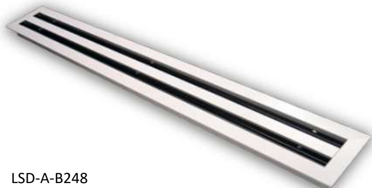
LSD-A-B248 DIFUSOR LINEAL 2 SLOTS 1200MM / 93MM