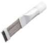
LT-352 PEINE SERPENTIN