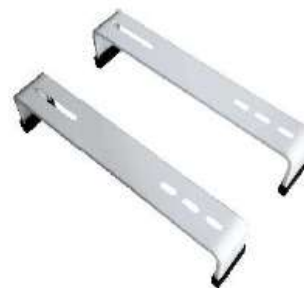
TB-125A SOPORTE PISO CAPA INOXIDABLE 100x500x80x2mm 250Kg