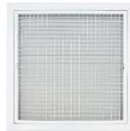
AGF-F REJILLA EXTRACCION CON Y SIN FILTRO TIPO REGISTRO TODAS LAS MEDIDAS