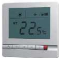
TH108 TERMOSTATO DIGITAL FAN COIL FRIO O CALOR