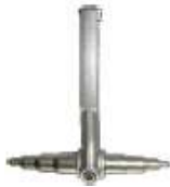
ZRS-22 EXPAND. DE TUBO MANUAL 3/8" - 1/2"/5/8" - 3/4" - 7/8"