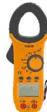
VC3267B MULTITESTER DIGITAL CON TENAZA