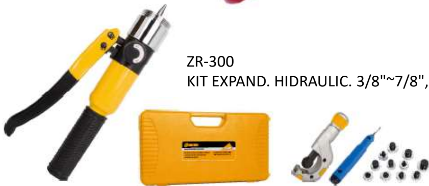
ZR-300 KIT EXPAND. HIDRAULIC. 3/8"~7/8", 1" & 1-1/8" /C.TUBO