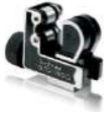
ZR-174 CORTA TUBO 1/8" - 1-1/8"