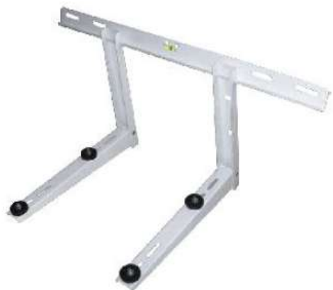
BRA-2002 SOPORTE MURO L CON NIVEL 9/36KBTU 790x390x550x2mm