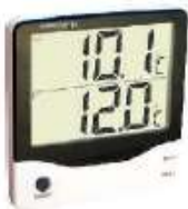
BT-1 TERMOMETRO MURAL