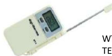
WT-2 TERMOMETRO PORTATIL