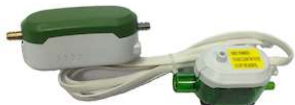
PC-12B BOMBA CONDENSADO ZERO 9/24 BTU