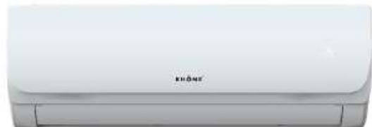
EQUIPOS SPLIT MURO ECOLOGICOS R-410A INVERTER 9.000 -12.000 -18.000 – 24.000 BTU 220V