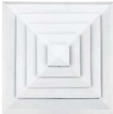
CD-SA4B15+OBD DIFUSOR 15X15CM ALUMINIO 4 VIAS