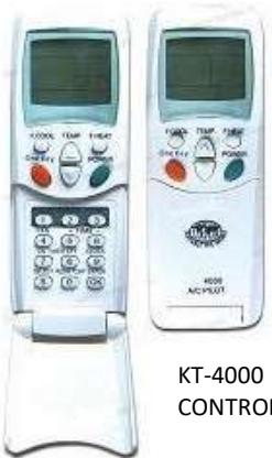
KT-4000 CONTROL REMOTO UNIVERSAL 4.000 MODELOS