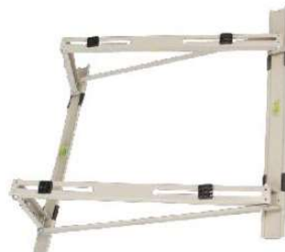
RBR-550(DWG-01) SOPORTE TECHO 9/36KBTU 800x550x550x2.0mm