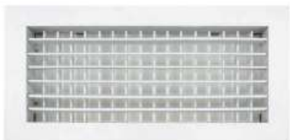
AG-DF REJILLA TC INYECCION ALUMINIO TODAS LAS MEDIDAS