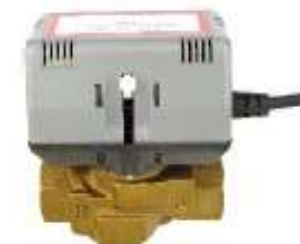
MVA-2W12 VALVULA MOTORIZADA 1/2" 2 VIAS ZERO