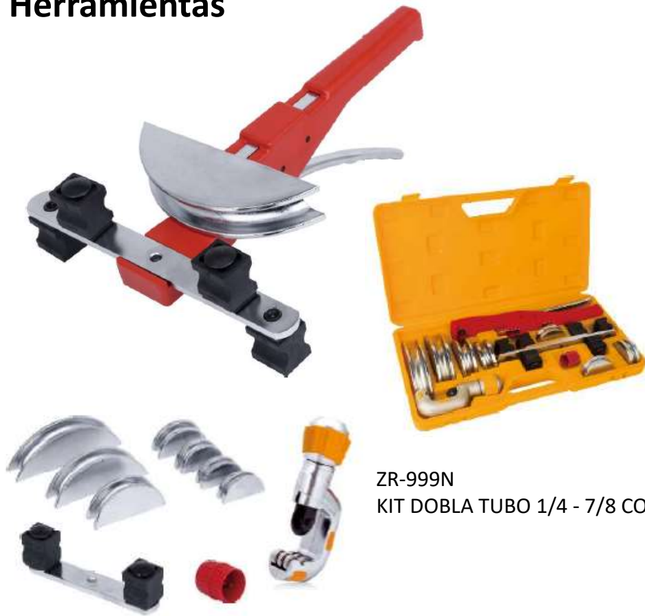
ZR-999N KIT DOBLA TUBO 1/4 - 7/8 CORTA TUBO / ESCARIADOR