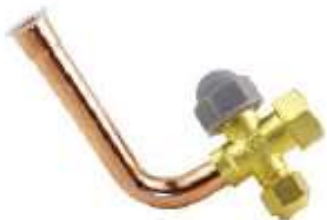
AV-1B VALVULA DE SERVICIO 1/4"x0.65x85