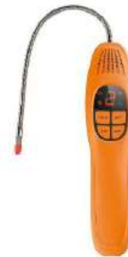
SLD-500 DETECTOR DE FUGA R410A / R22 / R134A / R404A