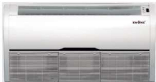
EQUIPOS SPLIT PISO CIELO R-410A INVERTER 18.000 -24.000 -36.000 – 48.000 – 60.000 BTU/HR