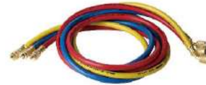
CH1448RBY MANGUERA MANIFOLD 800-4000Psi 1.20 Mts