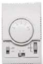
T6373B1068 TERMOSTATO ANALOGO FAN COIL 220V/50HZ