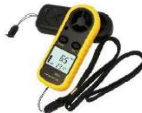
HT-816 TERMOMETRO ANEMOMETRO