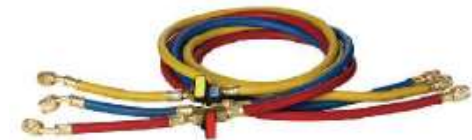
CHBV1436RBY MANGUERA MANIFOLD CON VALVULA 800-4000Psi 0.91 Mts