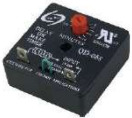
QD-068 TEMPORIZADOR 15AMP.