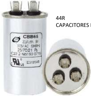
44R CAPACITORES DESDE 0,5 A 80 UF 440V