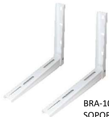
BRA-1001 SOPORTE MURO L 9/24KBTU 390x450x2.0mm