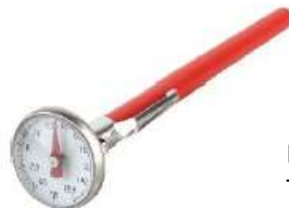
ET100 TERMOMETRO PINCHE DIGITAL