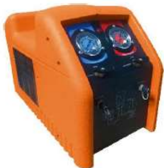
RM-229 RECUPERADOR REFRIGERANTE R410A/R22/R134A/R407C