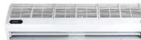
ACTCC09Y CORTINA DE AIRE 90CM 220V 50/60HZ ACTCC15Y CORTINA DE AIRE 150CM 220V 50/60HZ