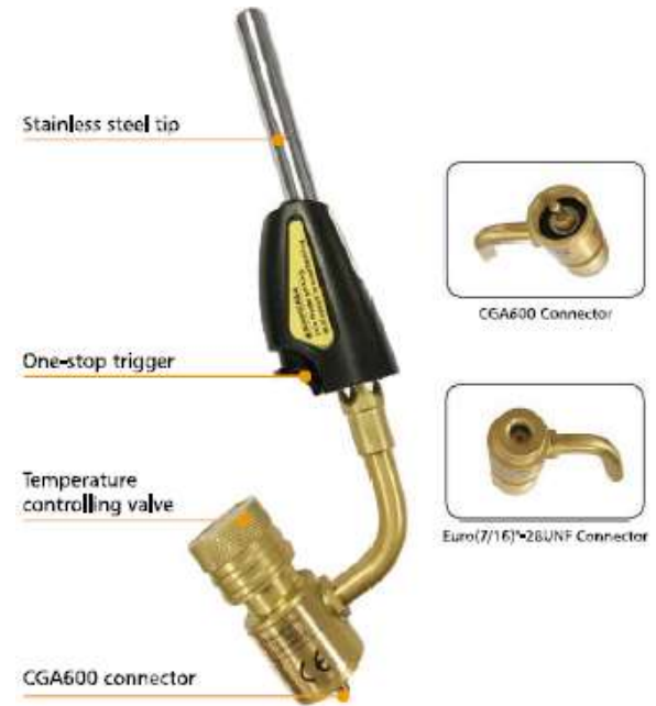
ZR-15 SOPLETE ENC. AUTOMATICO BOQUILLA DESMONTAB.