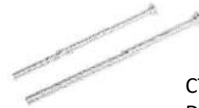
CT-102 DOBLA TUBOS TIPO RESORTE 1/4 - 3/4