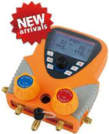
ZR-M550 MANIFOLD MULTIFUNCIONAL DIGITAL