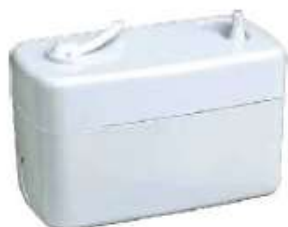
PC-24A BOMBA TIPO ESTANQUE/PRESENTACION ZERO 24 L/H TC