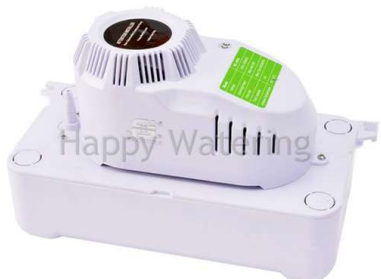
PC-125A BOMBA TIPO ESTANQUE ZERO 125 L/H