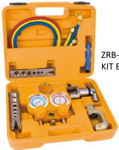
ZRB-5BA KIT EXPANDIDOR / ESCALIADOR / CORTATUBO / MANIFOLD