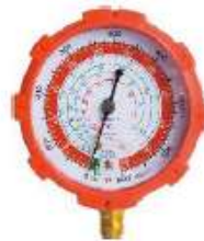
RG-500GF MANOMETRO ALTA R-410a