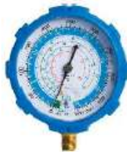
RG-250GF MANOMETRO BAJA R-410a