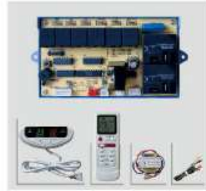
QD-U10A TARJETA UNIVERSAL DISPLAY MURO